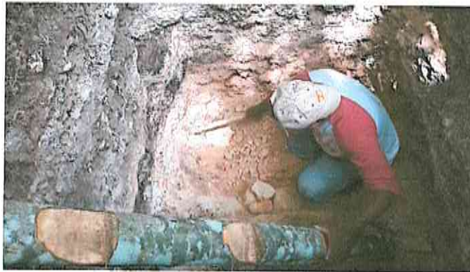
Figura 1. Excavación de la Suboperación 50-4 en el sitio arqueológico Naranjo, Petén, Guatemala.

Suboperación 50-4 los materiales registrados ascendieron a sesenta y dos (62) fragmentos cerámicos y cuatro (4) fragmentos líticos.