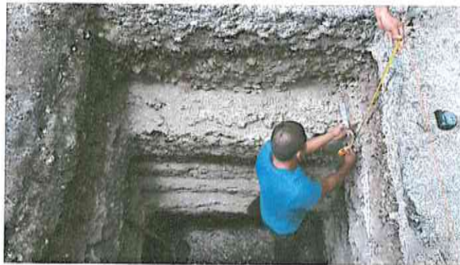
Figura 2. Documentación de las unidades de excavación realizadas al oeste de la Estructura B-20 del sitio arqueológico Naranjo, Petén, Guatemala.